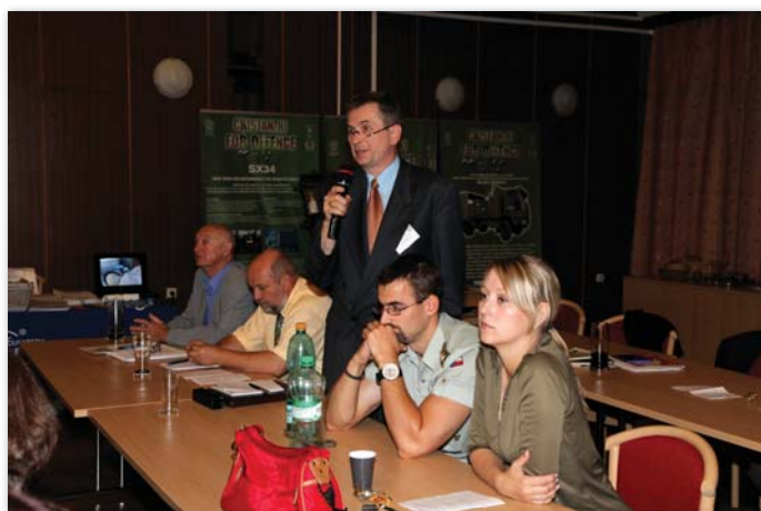
Diskuse při jednání konference