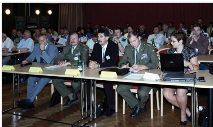
Pohled do jednacího sálu