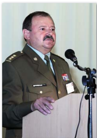
Vystoupení ředitele Ústavu OPZHN