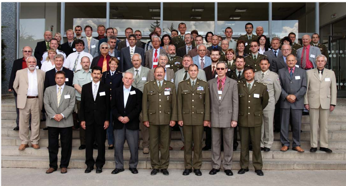
Společné foto účastníků konference