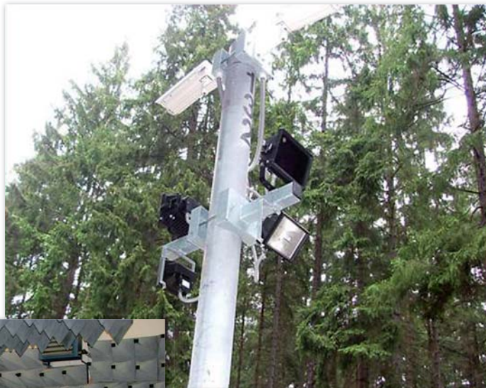
Perimetrický detekční systém