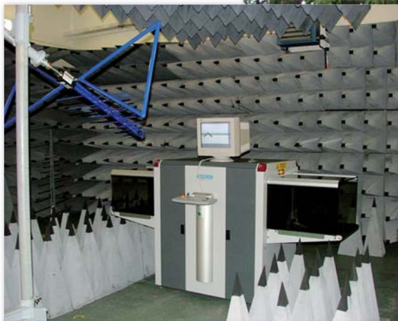
Zařízení sloužící k vyhledávání nebezpečných látek nebo předmětů

zeptat se na konkrétní problémy, které mají u svých útvarů a zařízení a na nejlepší způsoby jejich řešení.